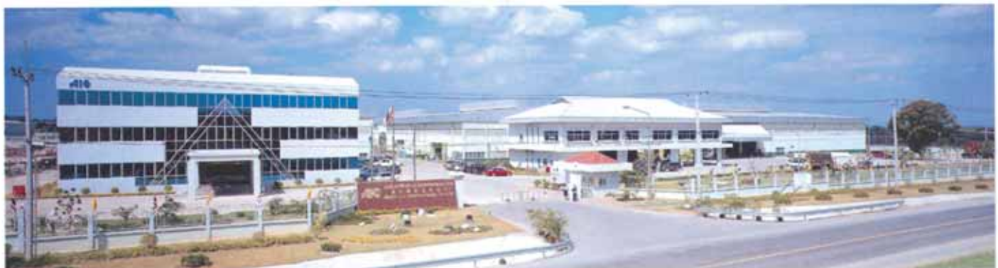
AEROFLEX INTERNATIONAL CO., LTD. HAUPTSITZ & FERTIGUNG, RAYONG THAILAND